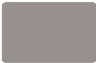
STB - 407 TITANIO METÁLICO

La caja del ascensor estará recubierta de un cerramiento de paneles de aluminio tipo Panel Composite de Cortizo o similar equivalente color TITANIO METÁLICO (STB-407) en franjas horizontales de 80 centímetros, de manera que la instalación no se mimetice con el edificio existente. El contacto con las escaleras existentes se realizará con carpintería acristalada de aluminio en el mismo lacado que la caja y en un plano retranqueado unos centímetros respecto a la fachada principal.